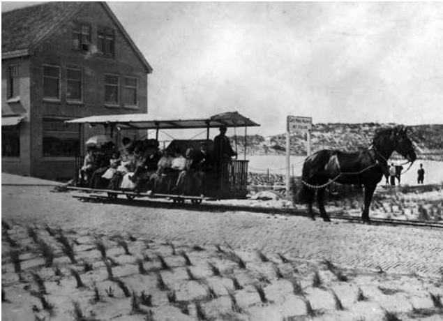
Deze eenvoudige, over smalspoor rijdende 'lorrie', vervoerde in de zomer van 1908 tussen Bergen en de piepjonge badplaats 14.000 betalende strandbezoekers.

De avond wordt afgesloten met een drankje.