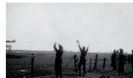
Voedseldropping bij vliegveld Bergen

Begin mei 1945 was al dagenlang door de Engelse zender omgeroepen dat er voedsel uit vliegtuigen zou worden afgeworpen. De dropping zou plaatsvinden op het Bergens vliegveld. Op 2 mei 1945 vond de eerste voedseldropping plaats. 20 vliegtuigen wierpen 1700 pakketten af. Op 5, 6 en 7 mei waren er opnieuw droppings. Door 70 vliegtuigen werden er 12.400 pakketten afgeworpen, wat met luid gejuich en grote vreugde door de plaatselijke bevolking werd